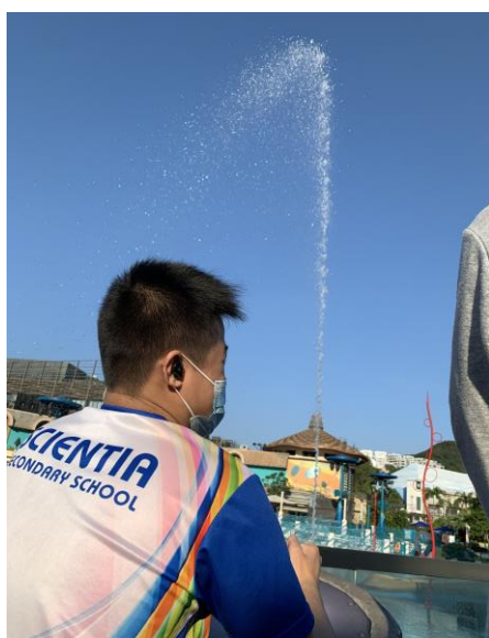
同學於海洋公園活動時的情影