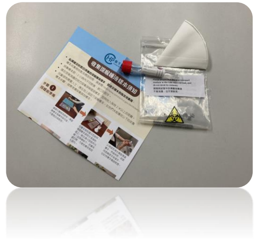
校方提供予同事的檢測包

為了讓學生在安全及衛生的環境中學習和活動，校方除了加強校園內的清潔及消毒，亦早在 12 月中旬安排全體教職工和外判員工就 2019 冠狀病毒病進行自願性檢測，目的是希望能夠全面地保障學生、教職工和家人的健康及安全，使大家放心地在校園內進行各項活動。（鄭仲明主任撰文）