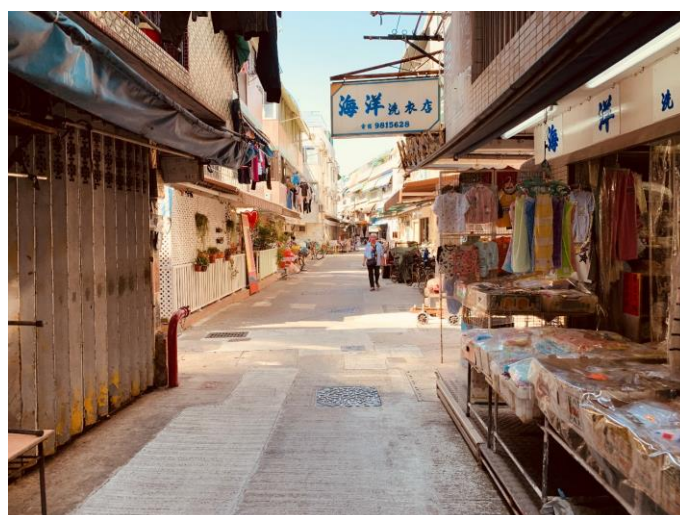
中四級教育考察活動的攝影比賽冠軍作品