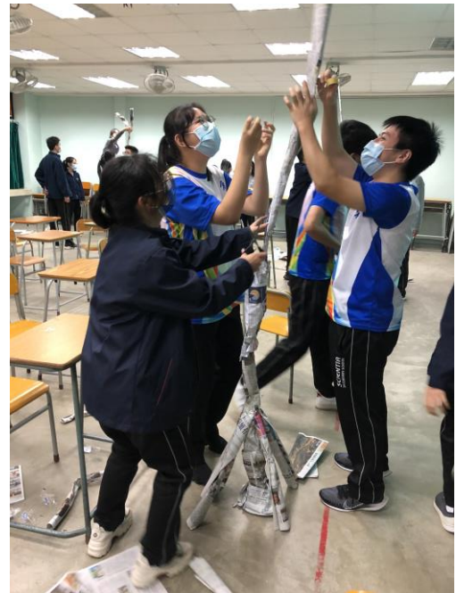
學生進行歷奇活動的情境