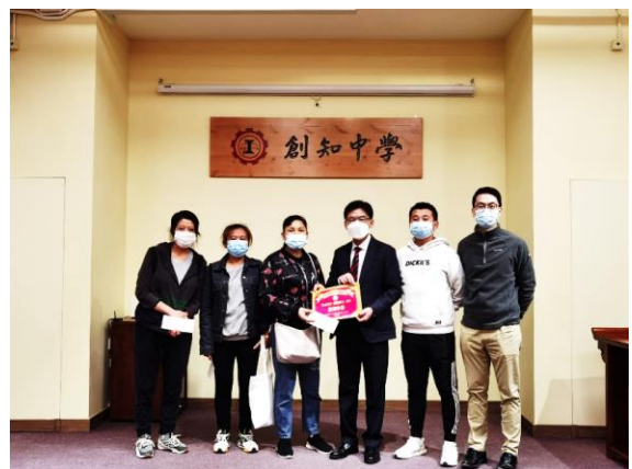
校長與一眾獲資助的家長合照