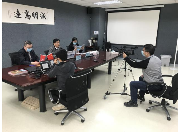
黃校長、盧副校長及黃副校長主持中一新生網上資訊