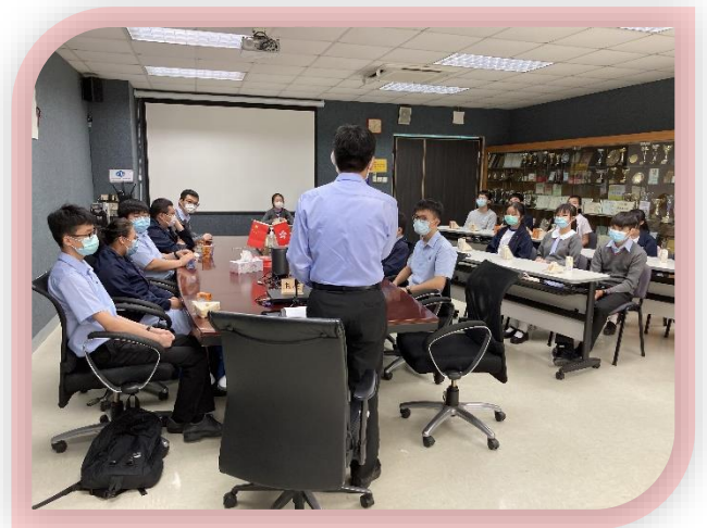
校長聆聽過學生代表意見後作出回應