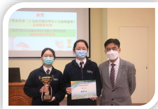
本校獲得「最積極參與學校獎」

透過「國家憲法日」的活動，學校希望同學明白《憲法》是國家的根本法，是治國安邦的總章程，具有最高的法律地位、法律權威及法律效力。而國家根據《憲法》第 31 條的規定，設立香港特別行政區，由全國人民代表大會制定香港特區《基本法》，規定香港特區實行的制度，表明國家對香港實施「一國兩制」、「港人治港」和高度自治的基本方針政策。（楊明佳主任撰文）