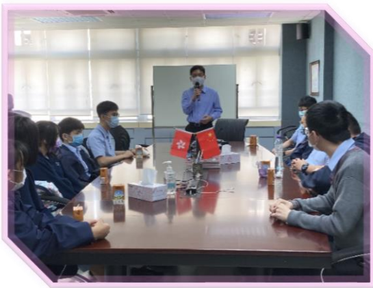
校長勉勵學生代表做好領袖工作

各級主席及副主席向校長提出不同意見，例如：大部份同學皆認為更換冷氣後，課室的學習環境更舒適，更加寧靜；部份同學對小食部的價格及份量提出改善的建議；亦有同學就讀報的內容及種類提供意見等等。校長聆聽意見後，作出解釋或答應跟進，並勉勵各級主席在艱難的疫情環境下要帶領同學同心抗疫，並努力學習，為未來作好準備。是次與校長對話大大加強了同學對學校的認識和歸屬感，其中中五級主席認為與校長真情對話，增強了同學們對學校的理解，也讓校長更掌握同學們的想法，對話很有價值，期待下半年繼續有這種互動的機會。（林崇生老師撰文）