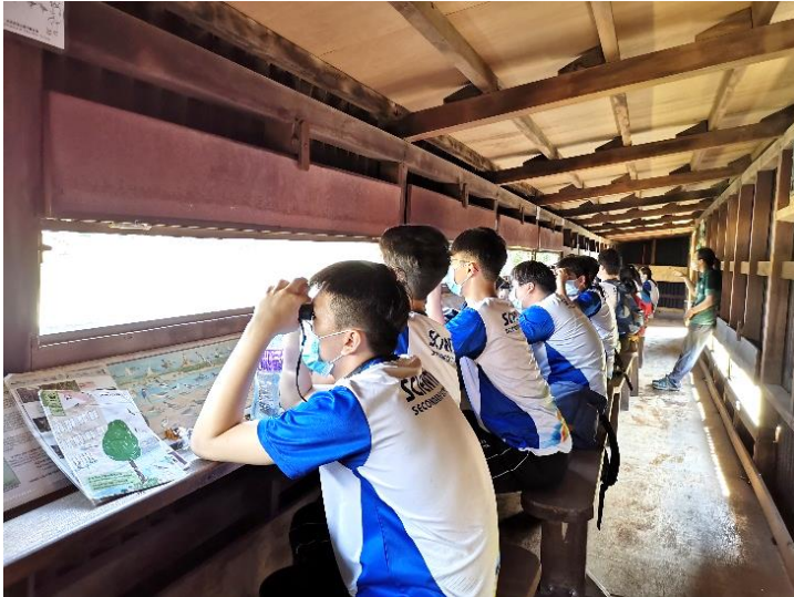
同學在觀鳥屋觀察后海灣的雀鳥

疫情下，中五級選修生物科同學於 11 月 20 日參加了由世界自然（香港）基金會主辦的米埔濕地教育課程，學生除了可在這片香港最大的濕地上學習各種濕地植物外，更能近距離觀察各種的雀鳥及過冬的候鳥，了解這個濕地大自然的瑰寶，也讓同學思考應如何保護及保育它們。（陳婉薇老師撰文）